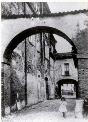
Castrium Sancti Petri, Maius MMXIX

LA FABBRICA DI S. FRANCESCO E I MINORI OSSERVANTI IN CASTRO SANCTI PETRI