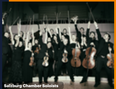
Salzburg Chamber Soloists