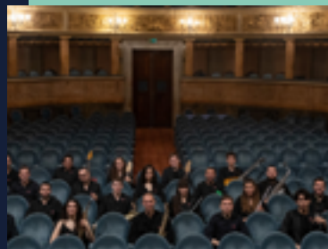
La Toscanini Next