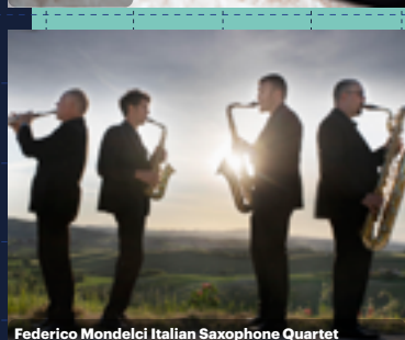
Federico Mondelci Italian Saxophone Quartet