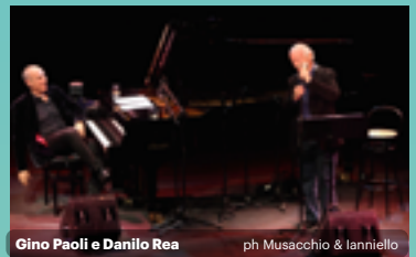
Gino Paoli e Danilo Rea