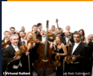
I Virtuosi Italiani