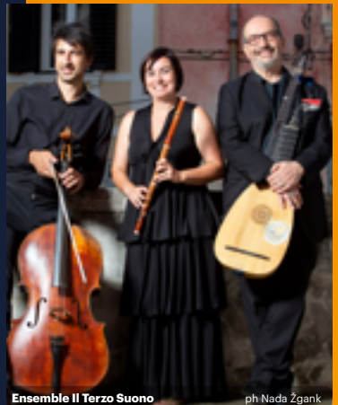
Ensemble Il Terzo Suono