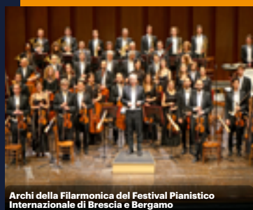
Archi della Filarmonica del Festival Pianistico Internazionale di Brescia e Bergamo