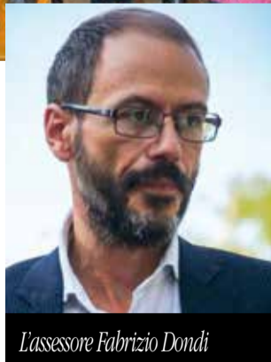
L'assessore Fabrizio Dondi

In occasione della Giornata Mondiale contro l'Omofobia, si è tenuta in Municipio nel mese di maggio la prima mostra fotografica nazionale "Famiglie", organizzata da RE.A.DY, la Rete Nazionale delle Pubbli-