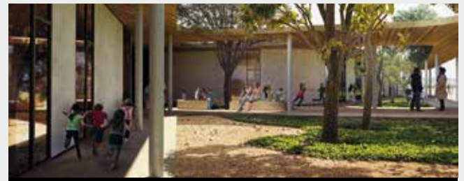
Nuovo Polo Scolastico di Osteria Grande: render della corte e dell'ingresso dell'edificio di materna e nido