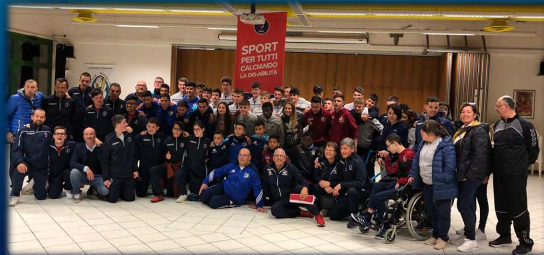
Foto di gruppo di fine Erasmus con gli amici di FFM Malta e i giocatori Under 15 del Bologna Fc