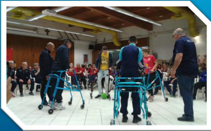
Attività con il «frame» al Villaggio Senza Barriere di Tolè

Questo progetto di interscambio internazionale è stato realizzato in collaborazione con l'associazione Frame Football Malta nell'aprile del 2019 a Bologna al Villaggio Senza Barriere di Tolè. Durante i 6 giorni di Erasmus sono state svolte varie attività sportive e culturali.