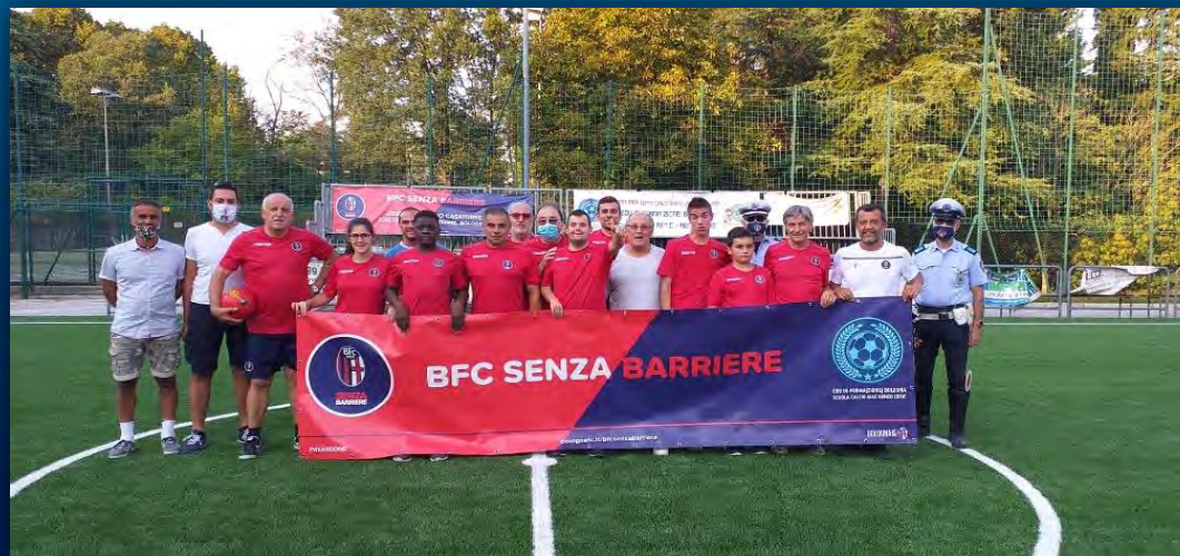
Castel San Pietro Terme