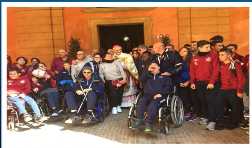
Incontro con il Cardinale di Bologna Don Matteo Zuppi