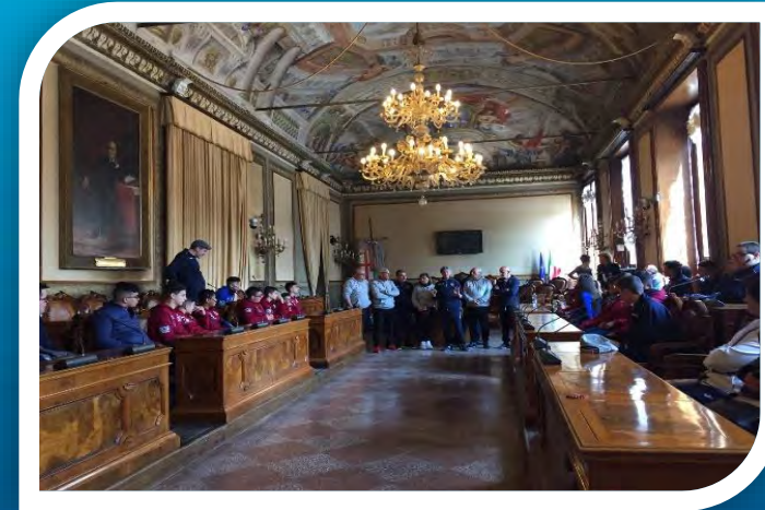
Visita al Comune di Bologna