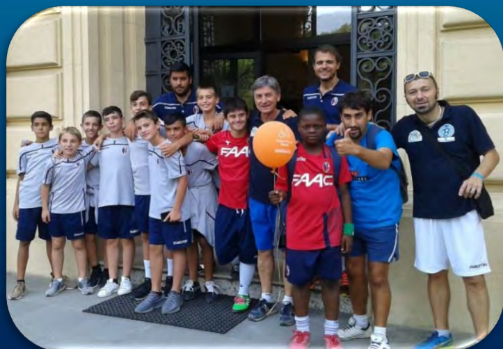
Festa del «Villaggio Senza Barriere» a Bologna