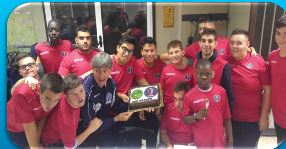
Festa con gli Alpini a Castel S.P.T.