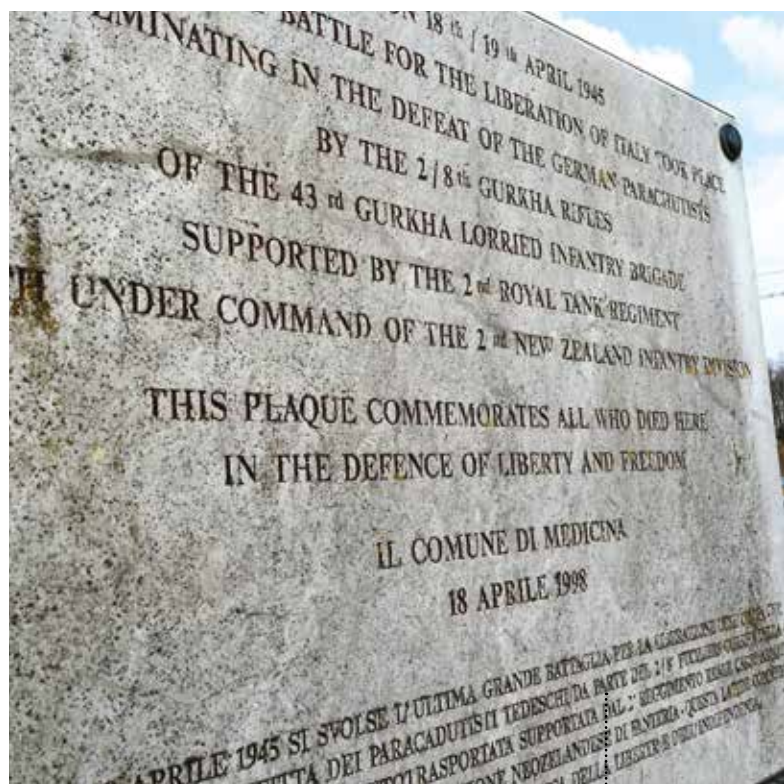
Targa sull'argine del Gaiana a Medicina in ricordo della battaglia del 18 e 19 aprile 1945.

Departure from Castel San Pietro Terme - P.zza XX Settembre. Reach Via Emilia in the direction of Bologna, just past the hamlet of Gallo Bolognese, turn right into Via Mori heading for Gaiana , at the crossroad with Via Stradelli Guelfi turn left then, after a few meters, take right into Via Bastiana until the Church of Gaiana. After the Liberation of Castel San Pietro on 17th April 1945, on the 18th and 19th, the war front moved forth along the course of Gaiana stream. On this extreme German defensive position, the so-called Anna Line, the last and bloodiest battles of the whole Italian military campaign took place. Here soldiers of General Anders' 2nd Polish Corps engaged the German 1st Division in a violent battle. Fighting cost the lives of many soldiers and entire