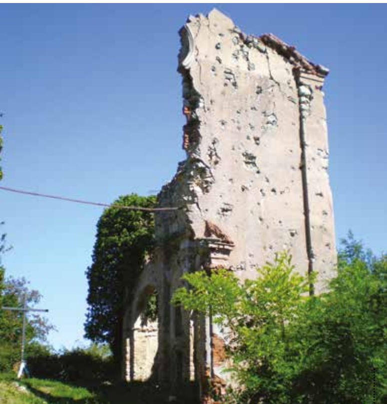
Rovine ex chiesa di San Martino di Montecalderaro. Ruins former church of San Martino di Montecalderaro.

By car to the hamlet of Montecalderaro (bus stop area Via Tanari) then on foot (suitable clothing and trekking shoes). Reservation required at 051/6951379 and expert assistance. Places: Montecalderaro Total length: approx. 6 km | Journey time by car: approx. 2 h