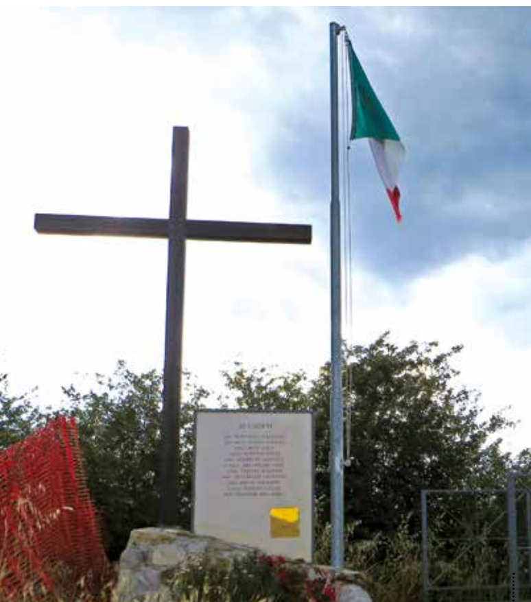
Monumento ai bersaglieri del Goito sulla collina di Poggio Scanno.

Monument to the Goito Bersaglieri on the hill of Poggio Scanno.