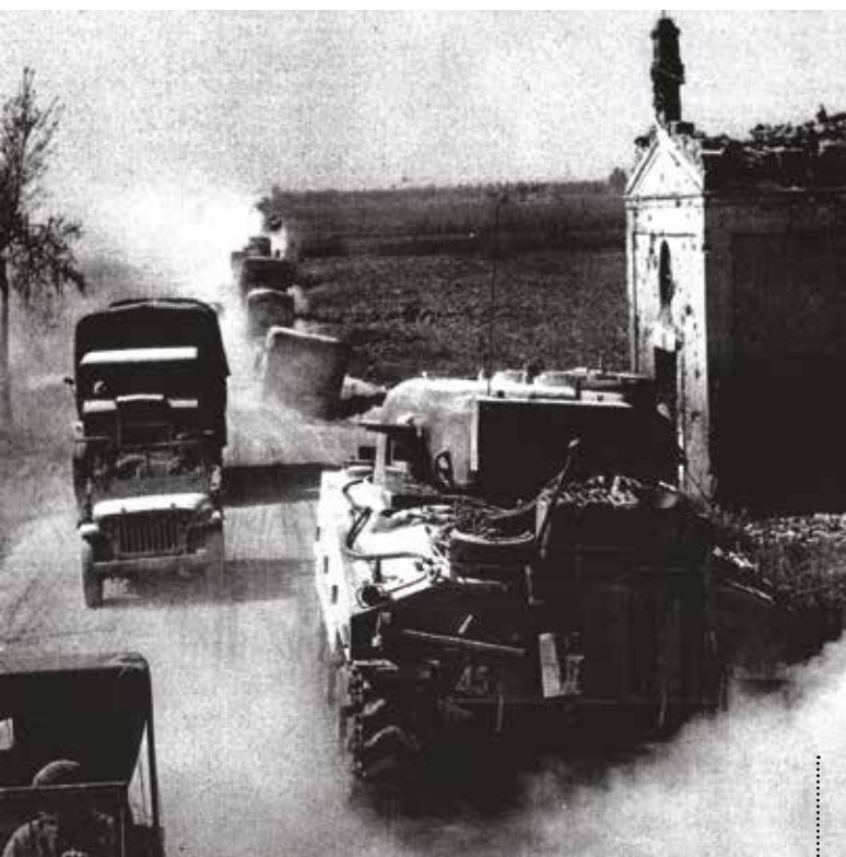
L'Oratorio di San Marco danneggiato dalle bombe.

The inscription of the air-raid shelter in Via Pillio in Medicina.