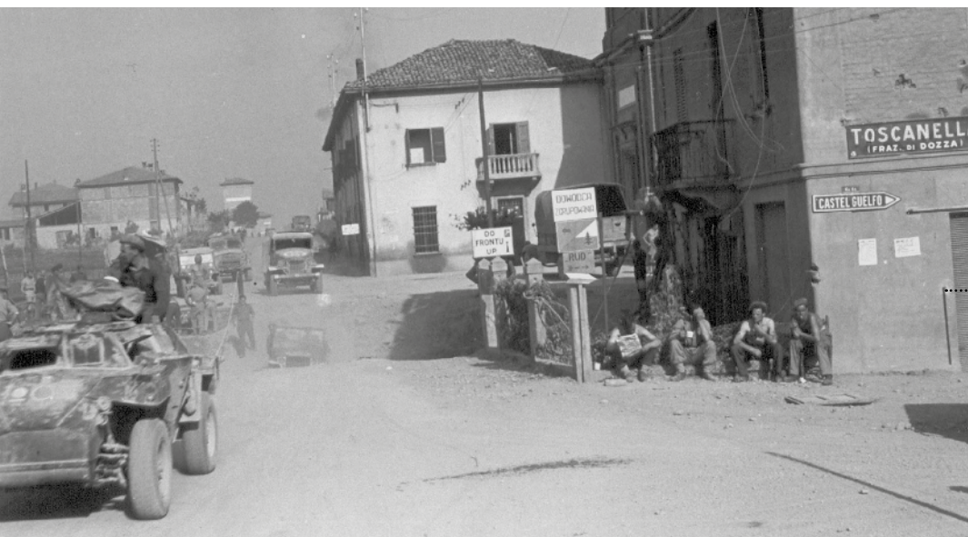
Truppe alleate sulla via Emilia avanzano attraversando Toscanella di Dozza.

Go on and reach Via Emilia in the direction of Imola . The town was awarded with the Gold Medal for brave resistance activity in 1985 in the presence of President of the Italian Republic, Francesco Cossiga. On the square Piazzale Giovanni Dalle Bande Nere stands Rocca Sforzesca, whose origins date back to 1261. From the 16th century the fortress was used as a prison. During the war period Nazi-Fascists had been detaining several dozen political prisoners, some of whom were killed or deported to concentration camps. In memory of them a commemorative plaque was placed by Anpi at the entrance courtyard. Right next to the Fortress, with entrance in via Fratelli Bandiera 23, you