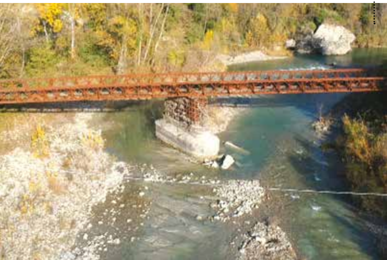
Ponte di Bailey sul Santerno a Borgo Tossignano Bailey Bridge over the Santerno in Borgo Tossignano