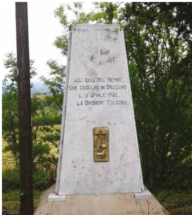
La stele posta a Case Grizzano dedicata ai caduti della divisione Folgore.

Reach Via Emilia in the direction of Bologna and turn right into Via Malvezza to reach Casalecchio dei Conti , a place where on 18th and 19th April 1945 Italian soldiers allied with the British 8th Army paid a high tribute of blood. On the wall of the local cemetery a descriptive panel and a plaque recall the events occurred here and the fallen soldiers of the 87th and 88th regiments of the Friuli Fighting Group. After 200 meters, a sign on the left indicates a dirt road leading to Case Grizzano . In this small group of houses on a hillock, the 183rd Nembo Paratroopers Regiment of the Gruppo di Combattimento Folgore won with brave resistance the so called "Grünen Teufel", the German paratroopers of the 1st Division who guarded this area to defend Bologna against the Allied advance, thus paving the way for the Liberation of Bologna. Among these houses a fierce battle was fought by the Italian soldiers who finally achieved victory. Go left along the paved road and after 2 km you will reach the junction for Varignana, follow the road sign for Palesio and a few meters after the junction, in a place called "il Condotto" you will find a plaque commemorating