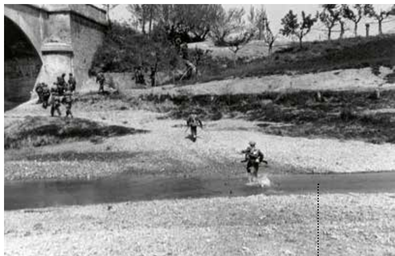
Truppe polacche attraversano il torrente Sillaro a Castel Guelfo.

was used as air-raid shelter by civilians during the air-raid alarms. The varnished inscription at the entrance is still visible and well preserved. Leaving Medicina heading for Castel San Pietro Terme, along Via San Carlo, after 4 km you will reach Poggio Piccolo where, next to the Sanctuary of Madonna di Poggio, there is a memorial plate commemorating the fallen victims along the passage of the front in the three neighbouring towns (Castel San Pietro, Castel Guelfo , Medicina). Continue along Via San Carlo and at the roundabout take the fourth exit leading to Castel Guelfo , pass the town and go on in the direction of Imola and at the first roundabout turn right into via di Dozza SP30. At the end of a long straight road cross the bridge over Sillaro river, which marks the border with Imola. It is a place of memory as well, since the liberation troops passed from there. The bridge was saved and demined by Polish sappers. The rescue of this artifact was of fundamental importance as it allowed military vehicles to cross the river, thus carrying the liberation troops to the decisive battleground of Gaiana. Soldiers were informed and guided by a local peasant woman who, when the war was over, had a votive pillar erected in memory of the wartime near the bridge, a place which is still today the destination of pilgrimages of local people.