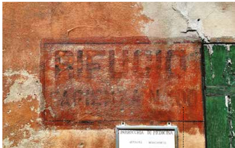
L'iscrizione del rifugio in Via Pillio a Medicina.

Il ponte fu salvato e sminato dai genieri polacchi e il salvataggio di questo manufatto fu di fondamentale importanza per consentire l'attraversamento dei mezzi bellici delle truppe della Liberazione coinvolte nella decisiva battaglia della Gaiana. A fornire le informazioni ai soldati fu una contadina del luogo che a guerra finita fece erigere, a memoria del periodo bellico, un pilastrino votivo in prossimità del ponte, che è meta ancora oggi di pellegrinaggi dei guelfesi.