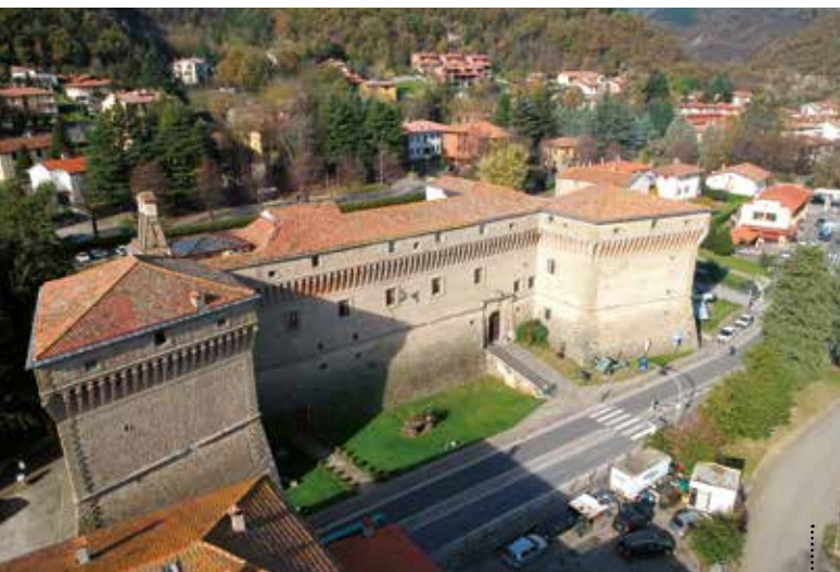
Castel Del Rio. Palazzo degli Alidosi, sede del Museo della Guerra e della Linea Gotica.