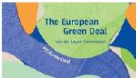
2019 EU Green Deal