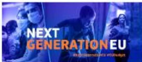
2020 EU Next Generation