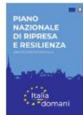
2021 Piano Nazionale di Ripresa e Resilienza